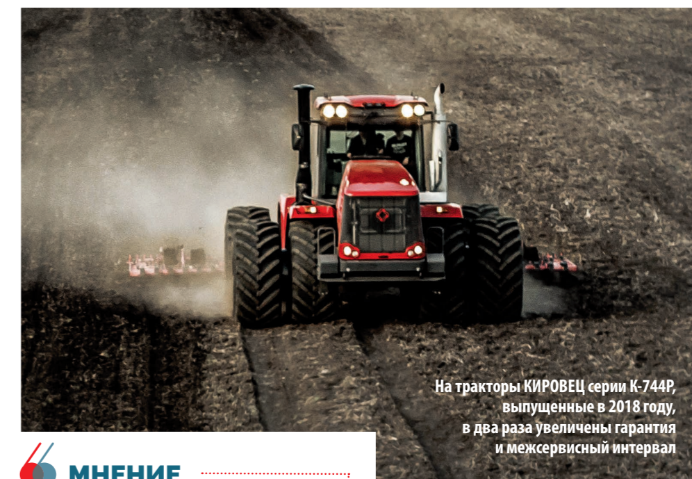
На тракторы КИРОВЕЦ серии К-744Р, выпущенные в 2018 году, в два раза увеличены гарантии и межсервисный интервал